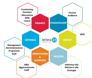
Le aree di analisi della Balanced Scorecard per la cultura